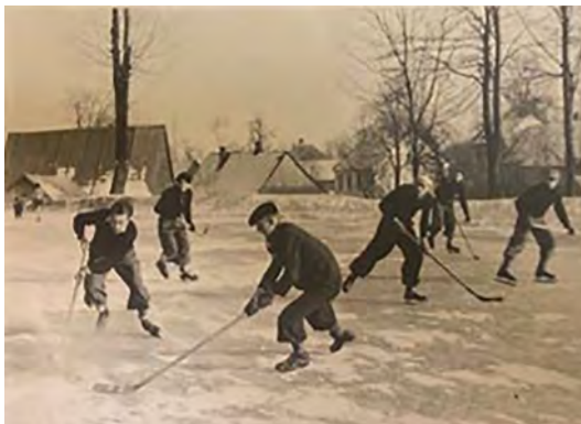
Zápasy horního a dolního konce na Axmaňáku, 1941

V období válečných let byly osudy místních hokejistů různé, někteří zůstali věrní kopřivnickému rybníku Axmaňáku, který se nacházel přibližně na místě dnešní ZŠ Alšova. A právě oni se pak podíleli na poválečné obnově hokejového oddílu. Po válce došlo ke sloučení obou předválečných hokejových oddílů SK i DSK UNIE, a ty nastupovaly dále pod názvem SK TATRA Kopřivnice. Po pádu „až na dno“ v roce 1947 se úspěchy začaly dostavovat. V sezóně 1949-50 zvítězili kopřivničtí hokejisté v Krajském přeboru II. třídy, v sezóně 1953-54 se SK stal přeborníkem kraje v I. A třídě a mohl se tak účastnit kvalikace o 2. ligu. Ve druhé polovině 50. let minulého století se hokejová základna rozrostla také o mládežnická a dorostenecká družstva.