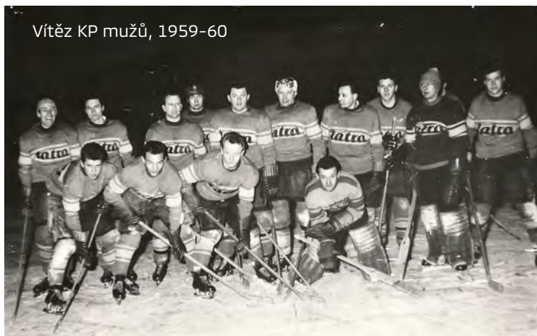
Vítěz KP mužů, 1959-60

V letech 1955 – 1965 se dosáhlo úspěchů v různých oblastech. Tím největším byla asi proměna kluziště a okolí. V roce 1956 začala jeho výstavba i s úpravou okolí „stadiónu“. V sezóně 1965–66 už umělé kluziště definitivně nahradilo to přírodní. Toto desetiletí se neslo také ve znamení postupů do vyšších soutěží. Na konci padesátých let Tatra vítězí v Krajském přeboru a postupuje do divize. V roce 1960 je divize přejmenována na Přebor SM kraje a o rok později se jejím vítězem stávají kopřivničtí muži. Na začátku let šedesátých tak proběhla kvalifikace o II. ligu, bohužel neúspěšná, stejně jako obě další v letech 1963 – 65.