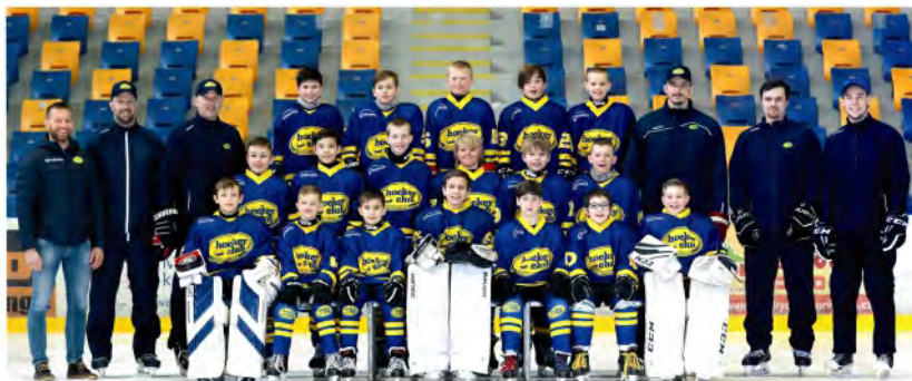
5. TŘÍDA 2021/2022