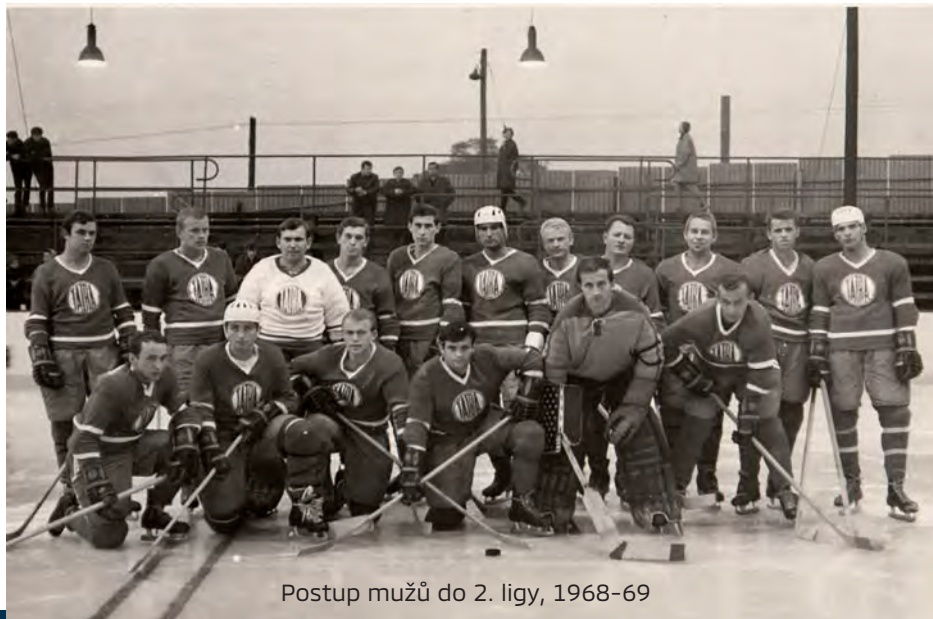
Postup mužů do 2. ligy, 1968-69