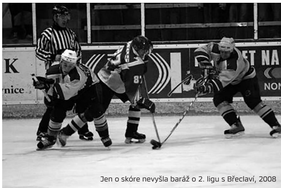
Jen o skóre nevyšla baráž o 2. ligu s Břeclaví, 2008

V oblasti mládeže začala od roku 2007 spolupráce s rožnovským hokejovým klubem, a to z důvodu splnění kritérií pro udržení žákovské ligy v Koprivnici, zejména co se počtu hráčů v jednotlivých žákovských kategoriích týká. Od roku 2010 neslo toto spojení i jednotný oficiální název HC Černí vlci, pod nímž nastupovali hráči v rámci žákovské ligy, později také kategorie dorostenecké, příp. juniorské.