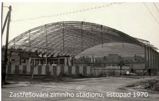
Zastřešování zimního stadionu, listopad 1970

V roce 1978 byl udělen oddílu ledního hokeje TJ Tatry Kopřivnice Diplom za zásluhy v rámci oslav 70 let od založení československého hokeje.