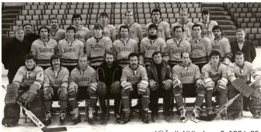
Vítěz II. NHL skup. C, 1984-85