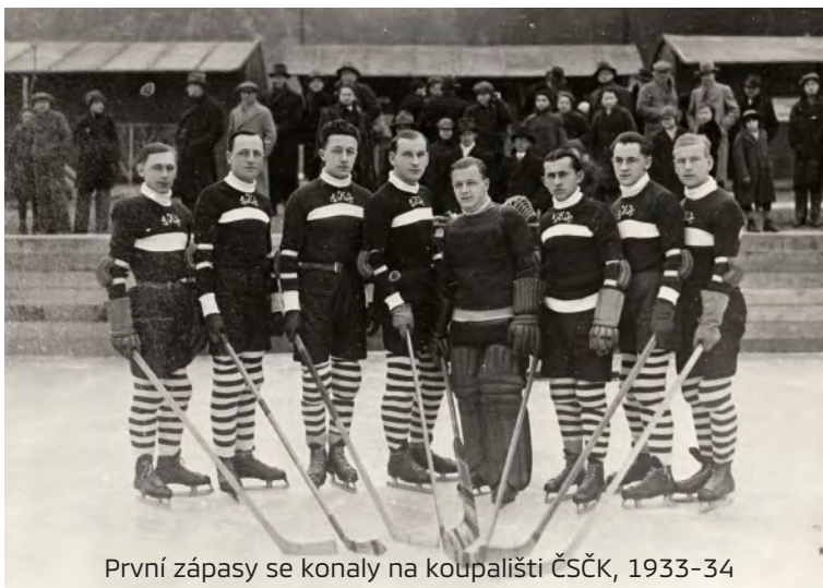
První zápasy se konaly na koupališti ČSČK, 1933-34

Když byl v roce 1932 založen SK Kopřivnice a o čtyři roky později hokejový odbor dělnického klubu pod názvem DSK UNIE Kopřivnice, vypadalo to, že lední hokej v Kopřivnici bude jen vzkvétat. Prvním velkým úspěchem SK byl získání titulu mistra Slezské župy hokejové v tzv. Extratřídě v sezóně 1937-38 a vše bylo na dobré cestě k postupu. To by ovšem nesměla přijít doba okupace a následně 2. světová válka, která rozmach hokeje, sportu a života nejen v Kopřivnici výrazně ovlivnila.