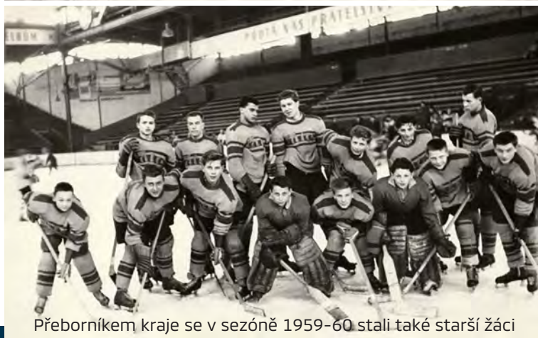
Přeborníkem kraje se v sezóně 1959-60 stali také starší žáci