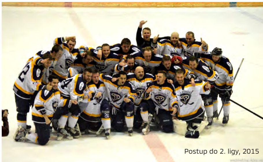
Postup do 2. ligy, 2015