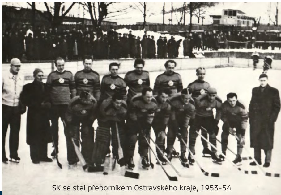
SK se stal přeborníkem Ostravského kraje, 1953-54