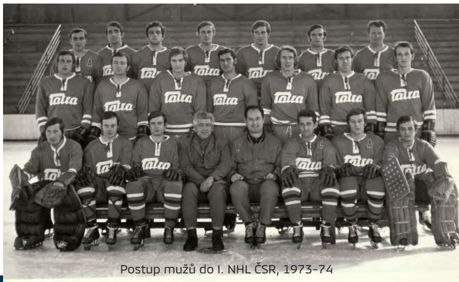
Postup mužů do I. NHL ČSR, 1973-74