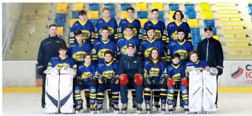
8. - 9. TŘÍDA