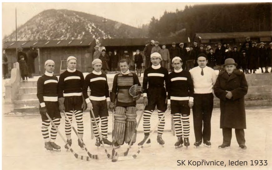
SK Kopřivnice, leden 1933

Na podzim roku 1932 skupina nadšenců založila odbor ledního hokeje a v lednu 1933 nastoupila SK Kopřivnice ke svému prvnímu mistrovskému utkání proti Frýdku-Místku, v němž se radovala z vítězství 4:3. K tréninkům i zápasům bylo v zimním období využíváno koupaliště ČSČK v Kopřivnici. Od té doby se toho v kopřivnickém hokeji událo mnoho a určitě je třeba vše náležitě oslavit a zavzpomínat.