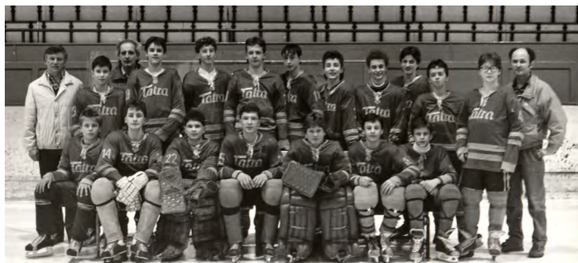
Starší žáci - nejlepší sportovní kolektiv města, 1988-89